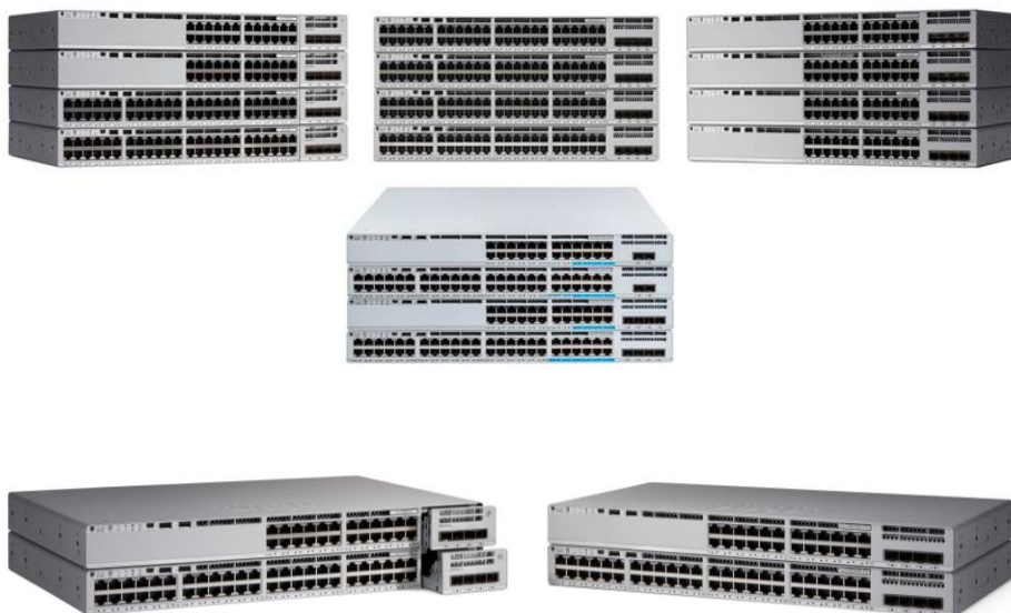
Figura 1. Switches Cisco Catalyst de la serie 9200

La serie Cisco Catalyst 9200 se compone de modelos de conmutador modular (C9200) y fijo (C9200L).